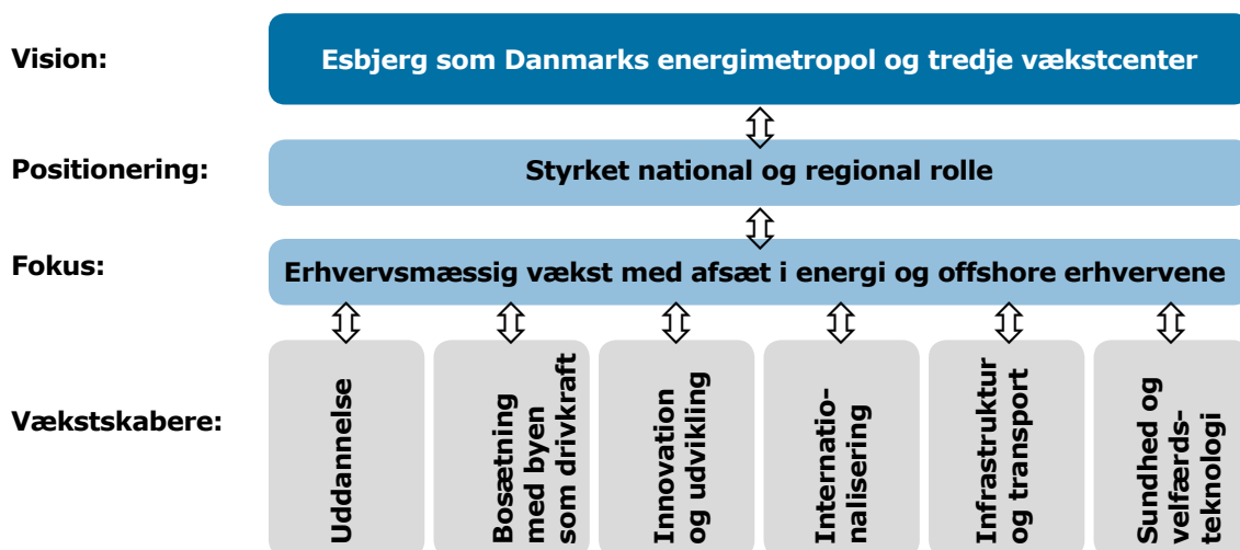
Figur 1: Sammenhængen i Vækststrategi 2020

Det strategiske samarbejde tager udgangspunkt i de politikker og strategier, der er inden for især forvaltningerne Børn & Kultur, Borger & Arbejdsmarked, Sundhed & Omsorg samt Fællesforvaltningen.