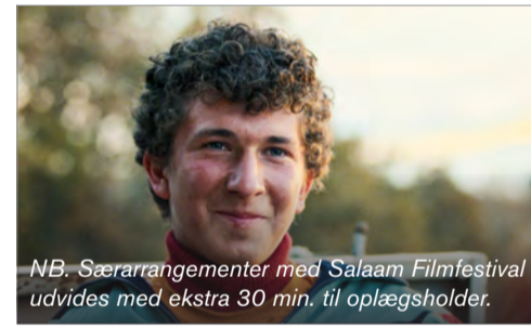
NB: Særrangementer med Salaam Filmfestival udvides med ekstra 30 min. til oplægsholder.